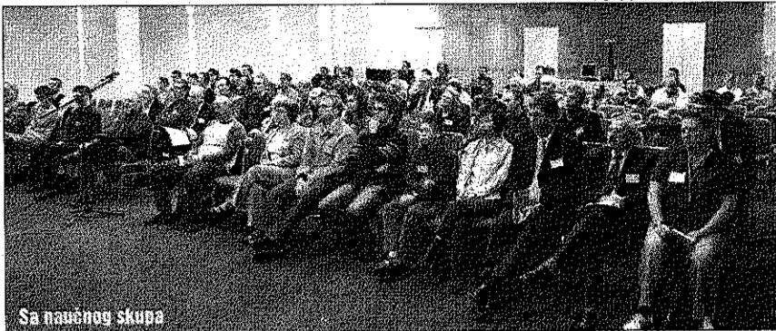
Sa naučnog skupa